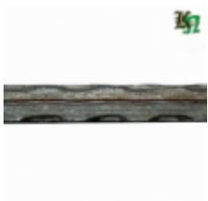
Квадрат, арт. 12Д2 3000мм, кв.12x12мм Вес: 3.43 кг Цена (за штуку): 480 руб.