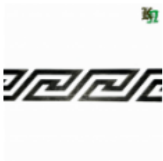
Декоративный прокат, полоса, арт. 820 1200х95х2.5мм Вес: 1.2 кг Цена (за штуку): 480 руб.