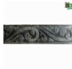
Полоса, арт. 30407П 3000x30x4мм Вес: 2.8 кг Цена (за штуку): 425 руб.