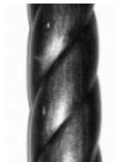
Витая труба, арт. Труба витая 60 3000мм, д=60x2,5мм Вес: 13 кг нет в наличии