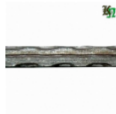
Квадрат, арт. 16Д2 3000мм, кв.16х16мм Вес: 5.85 кг Цена (за штуку): 1 000 руб.