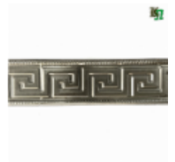
Декоративный прокат, полоса, арт. 412.26 2500х80х1мм Вес: 1.37 кг Цена (за штуку): 650 руб.