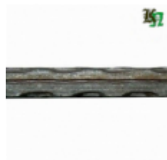
Квадрат, арт. 10Д2 3000мм, кв.10x10мм Вес: 2.38 кг Цена (за штуку): 320 руб.