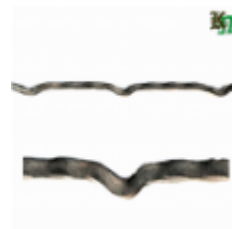
Квадрат для решетки, обжатый, арт. 178 1900мм, кв.12x12мм Вес: 2.14 кг нет в наличии