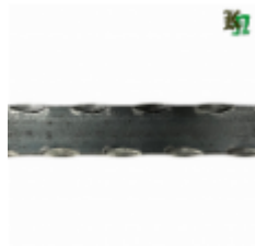
Полоса, арт. 20402П 2930x20x4 Вес: 2.2 кг Цена (за штуку): 320 руб.