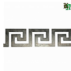
Декоративный прокат, полоса, арт. 826 1200х80х2мм Вес: 1.2 кг Цена (за штуку): 460 руб.