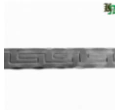
Полоса, арт. 40408 3000x40x4мм Вес: 4.3 кг Цена (за штуку): 400 руб.