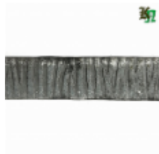
Полоса, арт. 30411П 3000x30x4мм Вес: 2.8 кг Цена (за штуку): 425 руб.