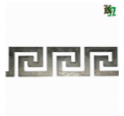
Декоративный прокат, полоса, арт. 827 1200х95х2мм Вес: 1.2 кг Цена (за штуку): 550 руб.