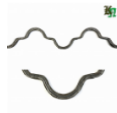
Монастырская вязь, обжатая, арт. 181 1560мм, кв.12x12мм Вес: 2.2 кг нет в наличии