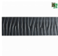
Полоса, арт. 40411П 3000x40x4мм Вес: 4.3 кг Цена (за штуку): 475 руб.