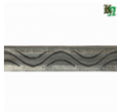
Полоса, арт. 20401П 3000x20x4мм Вес: 2.17 кг Цена (за штуку): 350 руб.