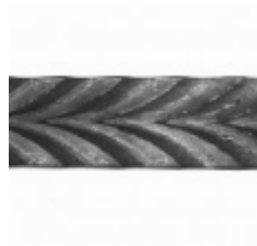
Полоса, арт. 32501П 3000x32x4мм Вес: 3.35 кг Цена (за штуку): 1 250 руб.