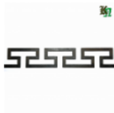
Декоративный прокат, полоса, арт. 824 1200х95х2,5мм Вес: 1.2 кг Цена (за штуку): 490 руб.