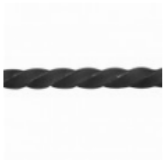
Квадрат, арт. 12Д4 3000мм, кв.12х12мм Вес: 3.45 кг Цена (за штуку): 700 руб.