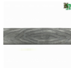
Полоса, арт. 25409П 3000x25x4 Вес: 2.4 кг Цена (за штуку): 390 руб.