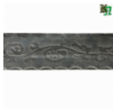
Полоса, арт. 40404П 3000x40x4мм Вес: 4.3 кг Цена (за штуку): 475 руб.