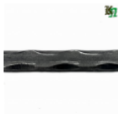
Квадрат, арт. 12Д5 3000мм, кв.12x12мм Вес: 3.43 кг Цена (за штуку): 540 руб.