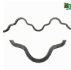
Монастырская вязь, арт. 180 1650мм, кв.12х12мм Вес: 2.26 кг Цена (за штуку): 450 руб.