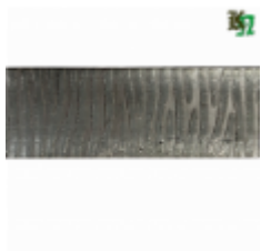
Полоса, арт. 50511П 3000x50x5мм Вес: 5 кг Цена (за штуку): 600 руб.