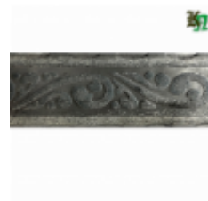
Полоса, арт. 50507П 3000x50x5мм Вес: 5 кг Цена (за штуку): 600 руб.