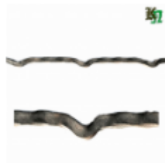
Квадрат для решетки, обжатый, арт. 179 1900мм, кв.10х10мм Вес: 1.5 кг Цена (за штуку): 350 руб.