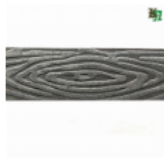
Полоса, арт. 40409П 3000x40x4мм Вес: 4.3 кг Цена (за штуку): 490 руб.