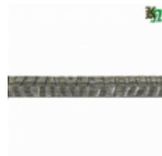
Квадрат, арт. 12Д3 3000мм, кв.12x12мм Вес: 3.43 кг Цена (за штуку): 480 руб.